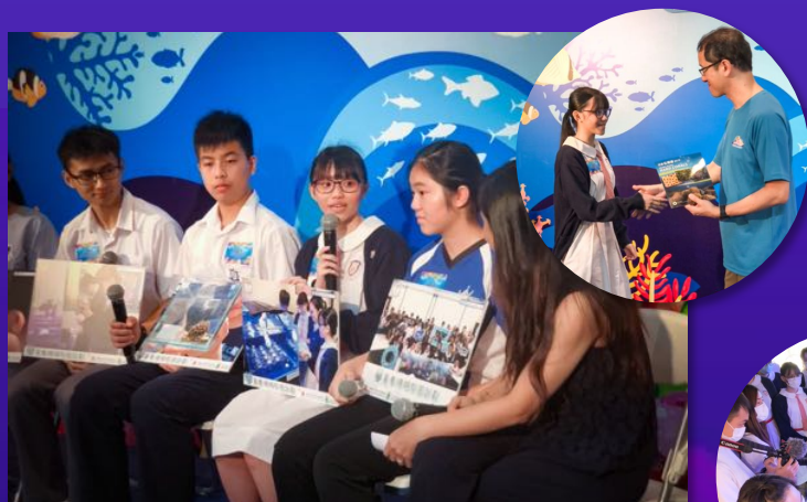
學生在香港海洋生物多樣性巡迴展覽中分享育養珊瑚的經歷。▲