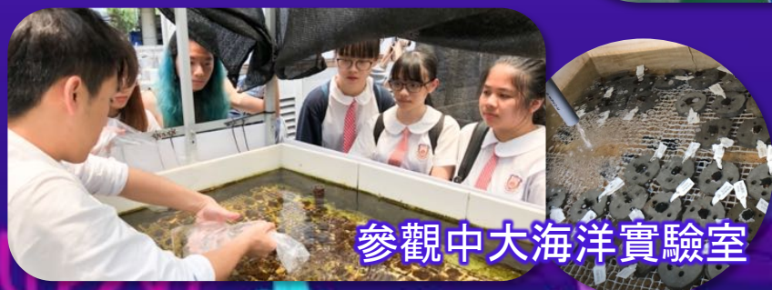
參觀中大海洋實驗室