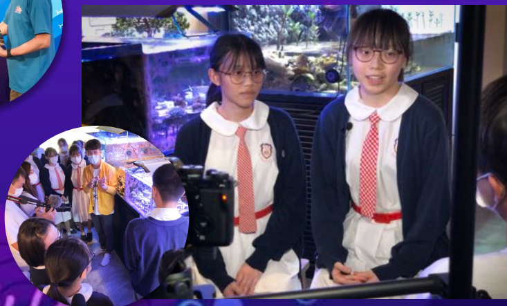
學生接受電視訪問分享參與計劃後的得着。▼